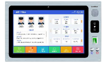
（支持人脸、指纹、刷卡识别录入）