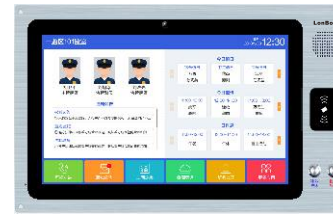
（支持人脸、刷卡识别录入）